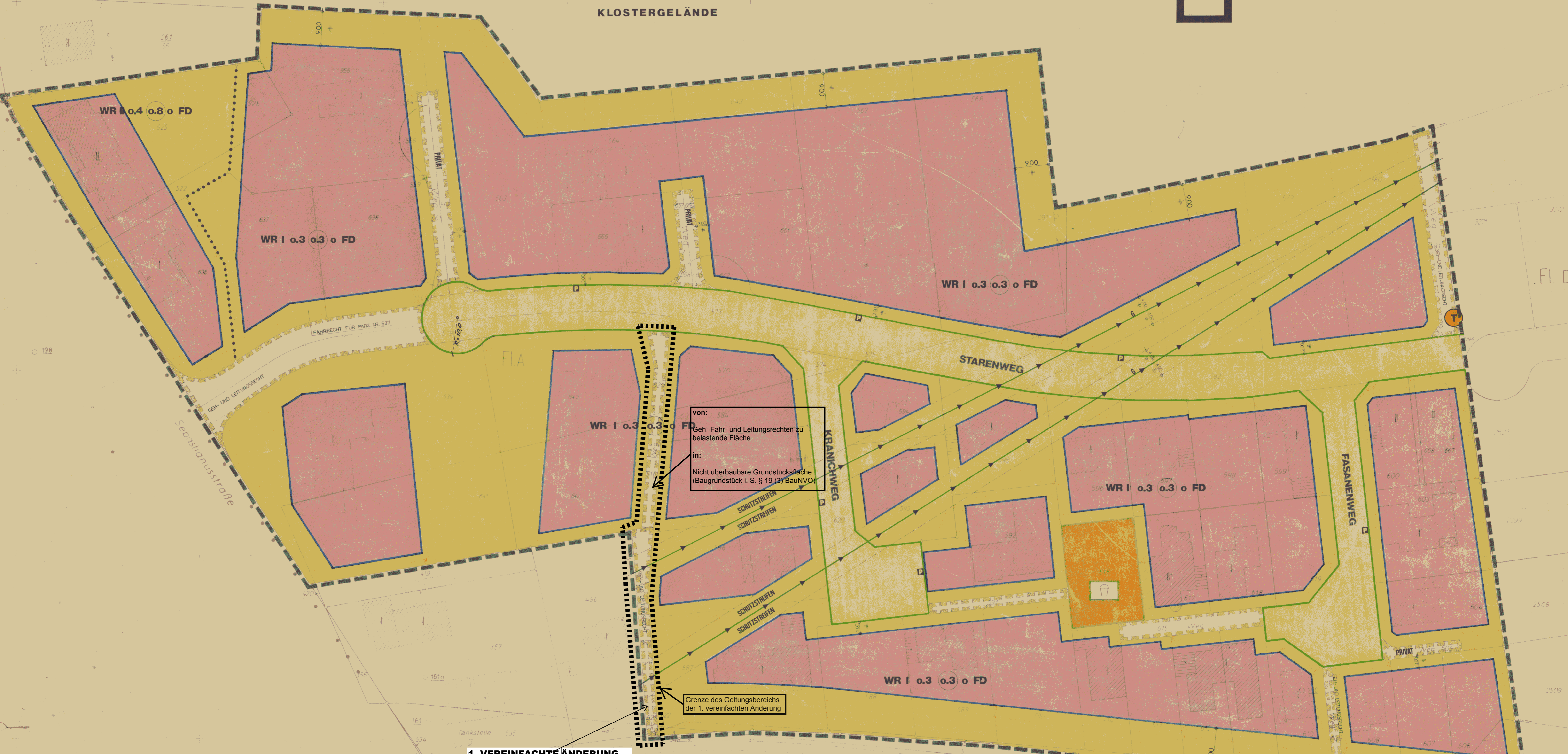
1. VEREINFACHTE ÄNDERUNG